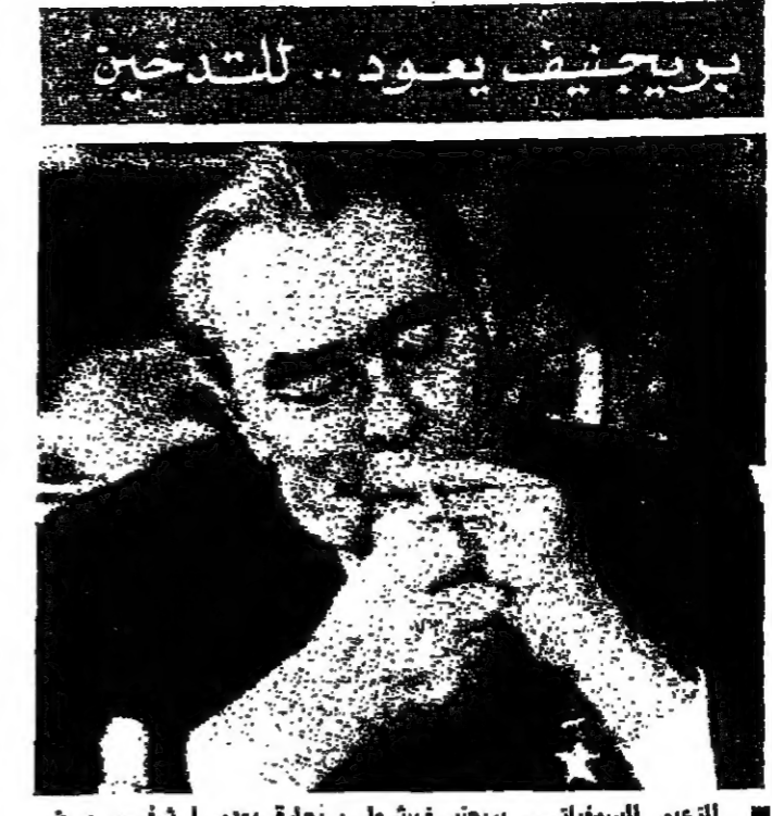
الزعيم السوفياتي بريجنيف يشعل سيجارة بعدما نشي من التطويرات وعاد لزيارة موسكو

قال السيد اسماعيل فهني وزير الخارجية المصري أمس، إن لا خلاف بين مصر والاتحاد السوفياتي حول المسائل الدولية، بل هناك اعتبارات مشتركة توحدهم بين رؤيتهم. وتكرر أن الإجماع السوفياتي بريجنيف سيجوز القاهرة في الشرق. وأعلن أن مصر لا تريد للاتحاد السوفياتي إلا أن يكون مورداً لمنتجاتها، وليس مورداً للأسلحة. وأضاف أنه لا يوجد في العلاقات المصرية والسوفياتية أي جانب من جانب واحد. وقال فهني: «نحن نرى العلاقات المصرية والسوفياتية على أساس المساواة والاحترام المتبادل». وأضاف أنه لا يوجد في العلاقات المصرية والسوفياتية أي جانب من جانب واحد. وقال فهني: «نحن نرى العلاقات المصرية والسوفياتية على أساس المساواة والاحترام المتبادل».